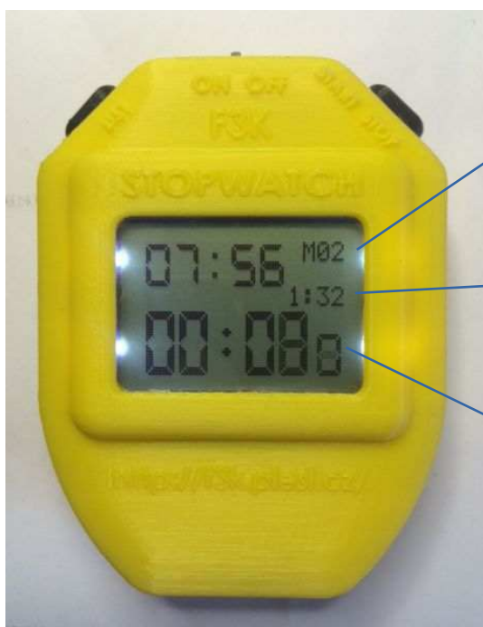
Číslo uloženého času v paměti

Po opětovném stisknutí pravého tlačítka ( START/STOP ) se aktuální stopovaný čas zastaví a uloží do paměti M01-M20 – mezi těmito časy je možné kdykoli listovat levým tlačítkem LIST a to i během aktuálního měření. Pod aktuálním číslem paměti se současně zobrazuje daný uložený čas.